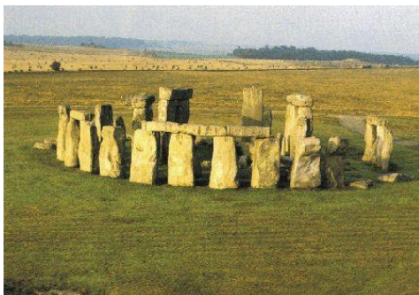
cercle de pierres

La pierre peut être taillée (en forme de colonne, d'amande, de dalle anthropomorphe, etc.) ou avoir été plantée telle quelle, plus ou moins brute.