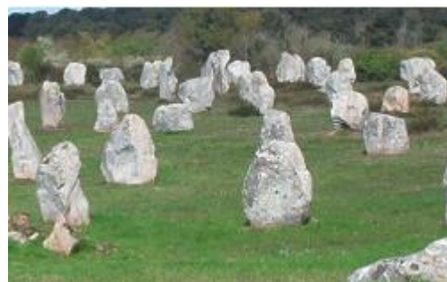
alignement de menhirs